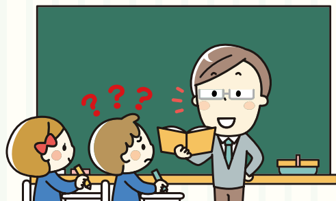
補聴援助システムを未使用の場合

「先生との距離が遠い」「教室が騒がしい」「グループで話しあう」などの状況では、補聴器や人工内耳を装着していても、ことばの聞き取りが難しくなってしまいます。